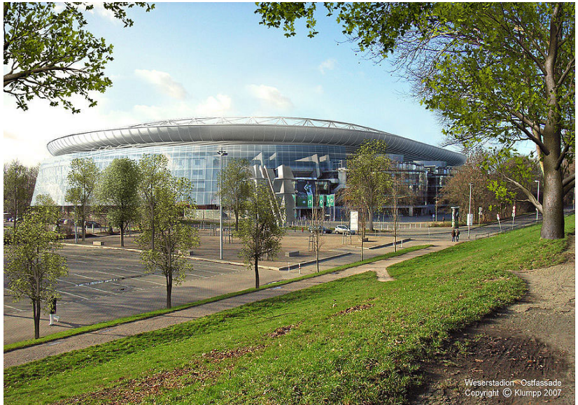
Weserstadion - Ostfassade

Doch vor allem für die Zuschauer soll das umgebaute Weserstadion, in dem auch weiterhin andere Veranstaltungen wie Konzerte stattfinden könnten, attraktiver werden. Durch das Heranziehen der Ost- und Westkurve an den Spielfeldrand entsteht ein reines Fußball-Stadion, so dass die Fans das Geschehen auf dem Platz noch näher erleben können. Was mit dem dadurch an Tiefe gewonnenen Raum hinter den Kur-